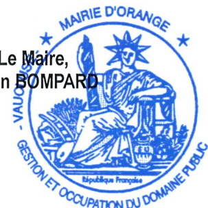
Le Maire, Yann BOMPARD

ARTICLE 21 .: Le présent arrêté est susceptible de faire l'objet d'un recours auprès du Tribunal Administratif de Nîmes dans un délai de deux mois à compter de la date de sa publication.