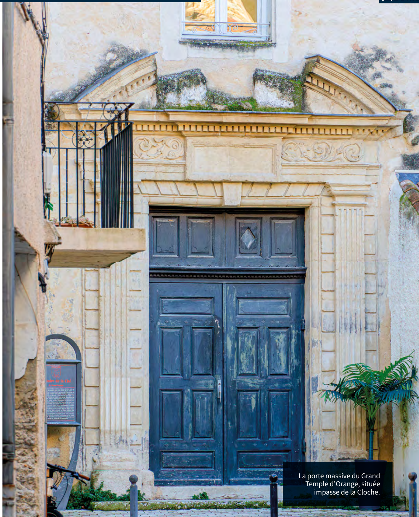
La porte massive du Grand Temple d'Orange, située impasse de la Cloche.