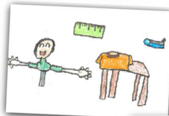
Dessin réalisé par les enfants du CLAE du Castel

Le dossier unique vous permet d'inscrire votre (vos) enfant(s) à l'école, à la restauration scolaire, aux accueils de loisirs péri et extrascolaires, aux stages sportifs et à l'Ecole Municipale des Sports.