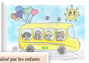
Dessin réalisé par les enfants du CLAE de la Croix Rouge