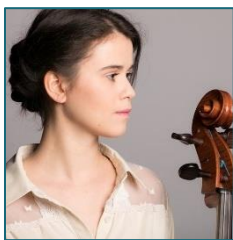
© Amandine Lauriol / Académie Jaroussky