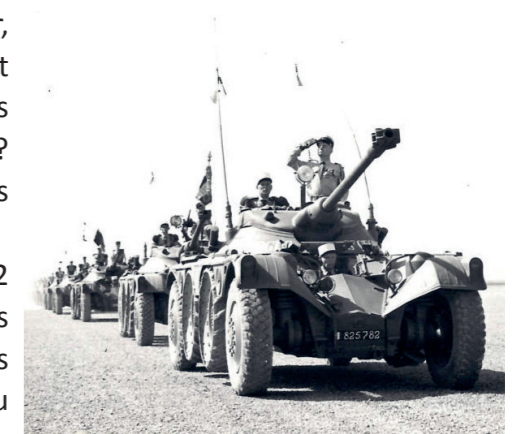
Juillet 1960, Saint Georges à Mers el Kébir

Libéré le 12 juillet 1965, il sera rétabli dans ses droits civiques en 1982 et décèdera le 15 avril 2000 à l'âge de 86 ans après de belles années à restaurer et embellir sa maison en Saône-et-Loire. Les honneurs militaires lui sont rendus par un détachement du Royal Etranger venu d'Orange.