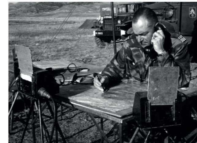
Algérie 1960. Chef de corps du Royal Etranger (1er REC)

Il est promu chef d'escadrons en juin 1952 et prolongera son engagement en Indochine qu'il terminera par 4 mois à l'état-major du général Navarre, chargé des opérations juste avant la chute de Diên Biên Phu. La France