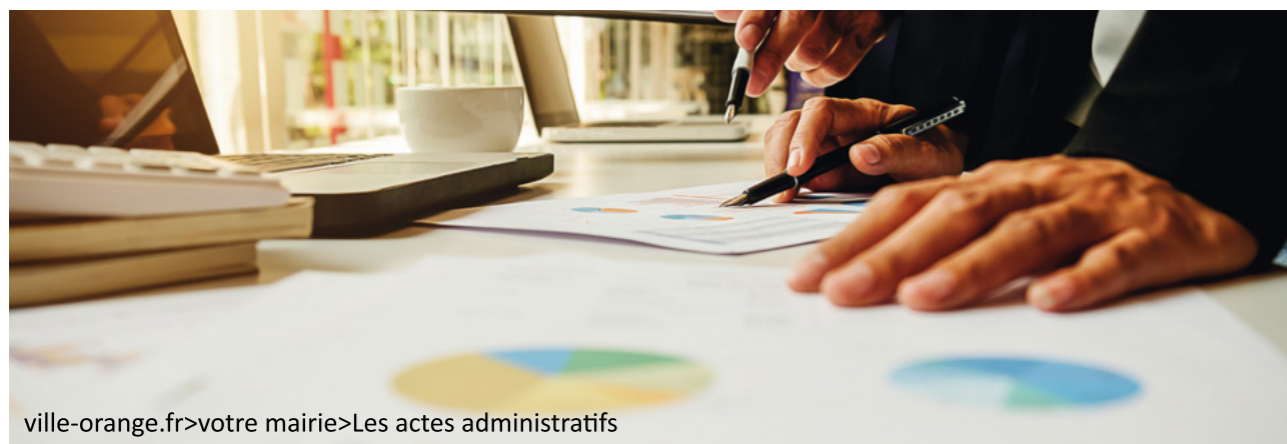
ville-orange.fr>votre mairie>Les actes administratifs

Le rapport d'observations définitives de la Chambre Régionale des Comptes portant sur la période 2012-2016, transmis en date du 13 février 2019 à la Ville d'Orange a fait l'objet d'une présentation publique dans l'instance délibérante de la commune le 15 mars 2019, conformément à la loi du 15 janvier 1990. 6 recommandations ont été adressées à la Ville.