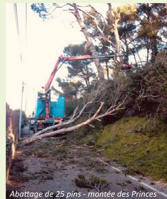
Abattage de 25 pins - montée des Princes

Afin de sécuriser la zone, l'abattage des pins a été réalisé vendredi 11 janvier, les services municipaux ont retiré les arbres menaçant la sécurité des passants. Ces pins d'Alep ont des racines très superficielles qui résistent mal au poids des ans et aux intempéries de l'hiver (pluie et vent), notamment sur un terrain en pente.