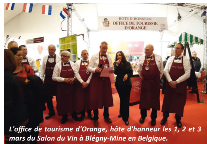
L'office de tourisme d'Orange, hôte d'honneur les 1, 2 et 3 mars du Salon du Vin à Blégny-Mine en Belgique.