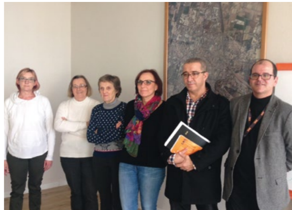
Les agents en charge du recensement ont été formés par le service population de la Mairie

Le départ du 1 er REC en juillet 2014 a été en partie compensé par l'arrivée des commandos parachutistes de l'Armée de l'Air. Cependant Orange prouve avec ses bons chiffres qu'elle demeure une ville attractive où il fait bon vivre de par la qualité de ses services, sa sécurité et ses animations. Depuis la mi-janvier et jusqu'au 24 février, la Ville a mandaté quatre agents recenseurs qui étudie l'échantillon de 8% des habitants retenus cette année. Tous les foyers qui sont recensés reçoivent un courrier pour les prévenir du passage de l'agent ou bien pour effectuer directement la démarche sur le site Internet dédié. La bonne collaboration des habitants avec les services permet d'assurer la fiabilité des informations et les projets attenants de la commune.