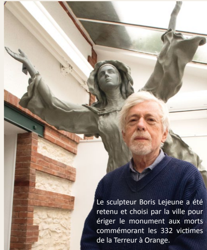
Le sculpteur Boris Lejeune a été retenu et choisi par la ville pour ériger le monument aux morts commémorant les 332 victimes de la Terreur à Orange.

Pour mieux connaître l'époque de la Terreur et la signification d'un tel monument commémoratif dans notre ville, une revue hors-série est disponible au service culturel cours Aristide Briand, 84100 Orange 1 euro