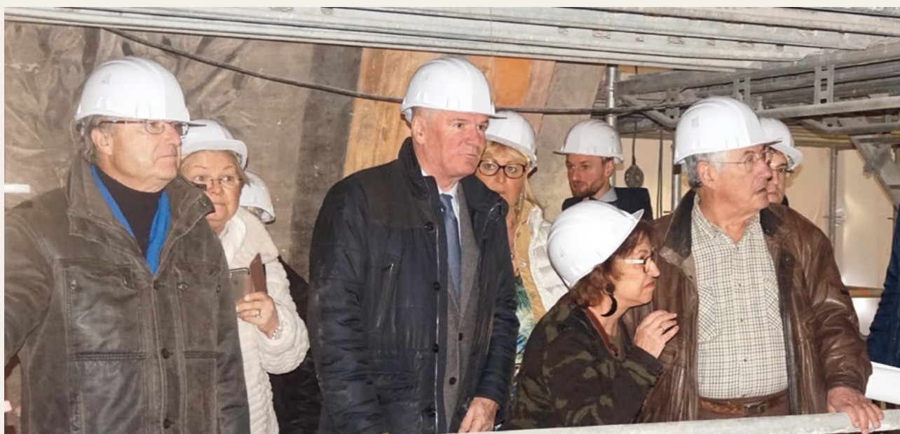
Le maire, Jacques Bompard, aux côtés de Didier Repellin, Architecte en chef des Monuments historiques.

Dans quelques mois, des menuisiers rejoindront l'équipe pour s'occuper des boiseries, ainsi que des électriciens pour améliorer l'éclairage de la cathédrale. Le montant total des travaux de restauration s'élève à 970 000 euros financés à 40 % par la Drac et 60 % par la ville.